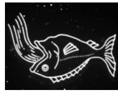
▲みなみのうお座 など